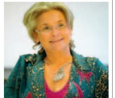
"Je n'ai jamais reçu d'invitations pour des matchs de foot" ■ V.L.

Des invitations personnelles, ça n'arrive pas souvent. Quand j'en ai, je les jette à la poubelle. Quand on veut me voir, je propose qu'on vienne me rencontrer au parlement. Par contre, c'est vrai que l'on nous