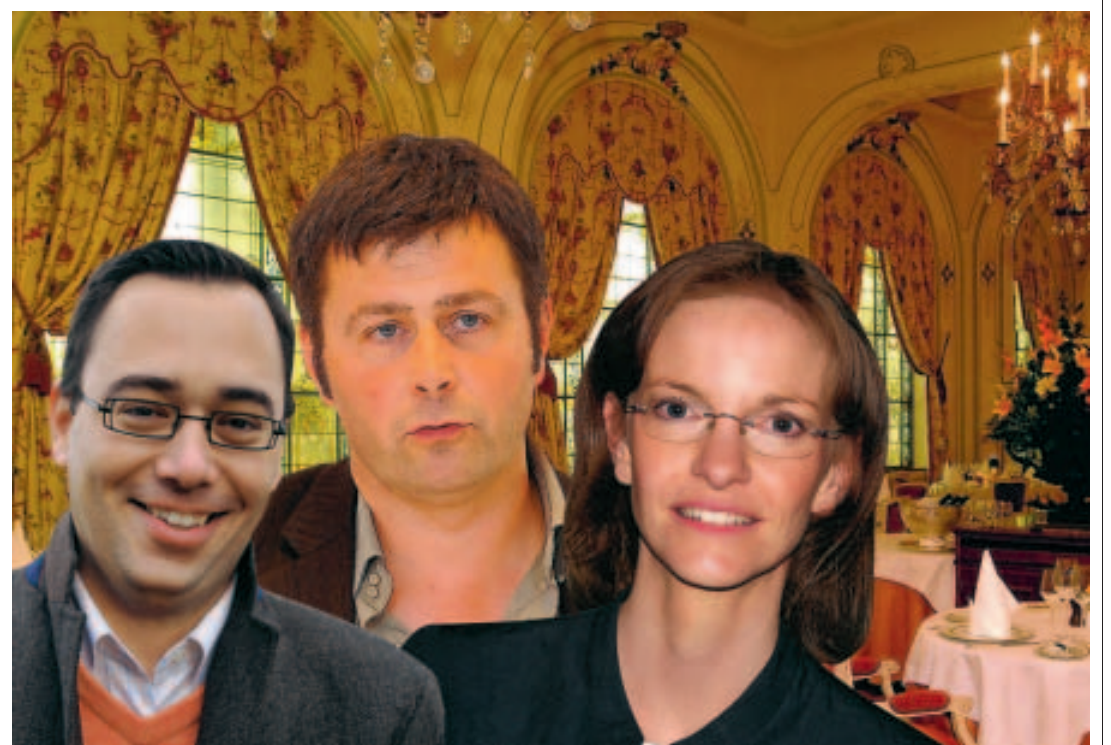
Entre le match de foot et le restaurant, les élus namurois sont sollicités par les entreprises ■ SUDPRESSE