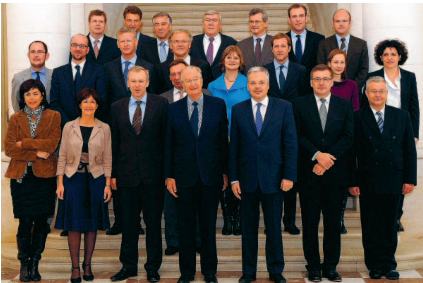
Retrouvera-t-on dans le prochain gouvernement des ministres namurois comme ce fut le cas avec Sabine Laruelle en 2007 ?